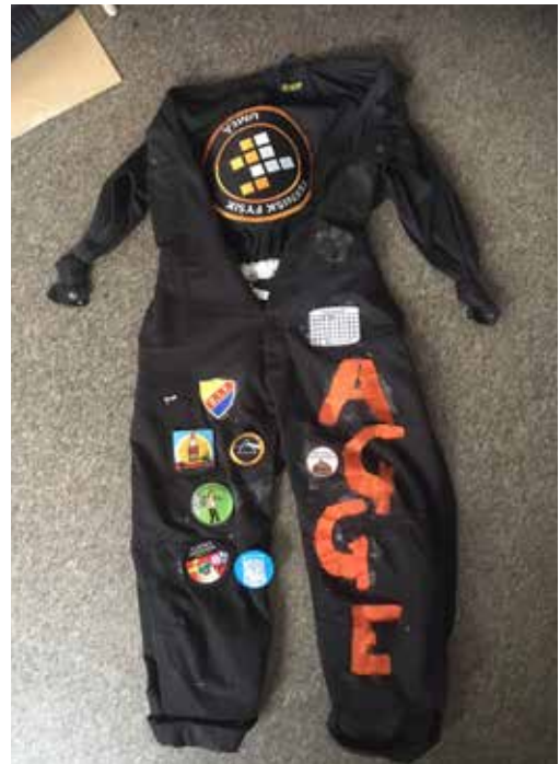
En fullt duglig overall