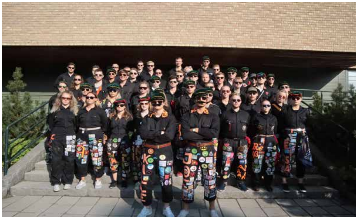
Overallsklädda, teknologmössbärande tekniska fysiker

Ja, varför travar egentligen Umeås teknologer omkring i Blåkläder?