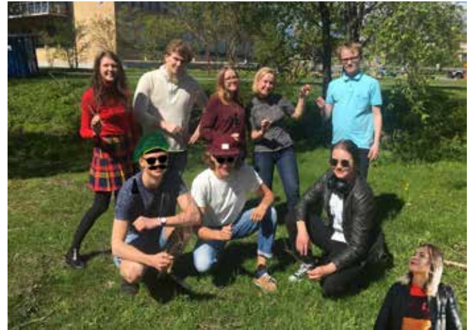
F-sektionens Styrelse 19/20

Att börja på universitet kan vara en stor omställning, särskilt för dig som flyttar hemifrån för första gången och kommer till en ny stad. Ett bra sätt att komma in i studentlivet är att utnyttja möjligheten att gå på mottagningen. Här kommer du att träffa och lära känna både klasskamrater och äldrekursare. Alla äldrekursare som du träffar, under mottagningen finns där för att du ska trivas och ha det bra, be dom om hjälp och ställ frågor vid behov.