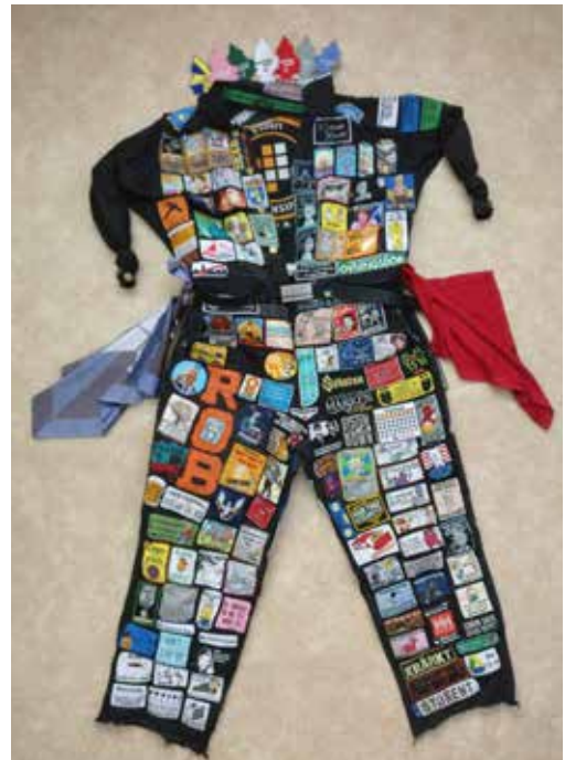
En full duglig overall